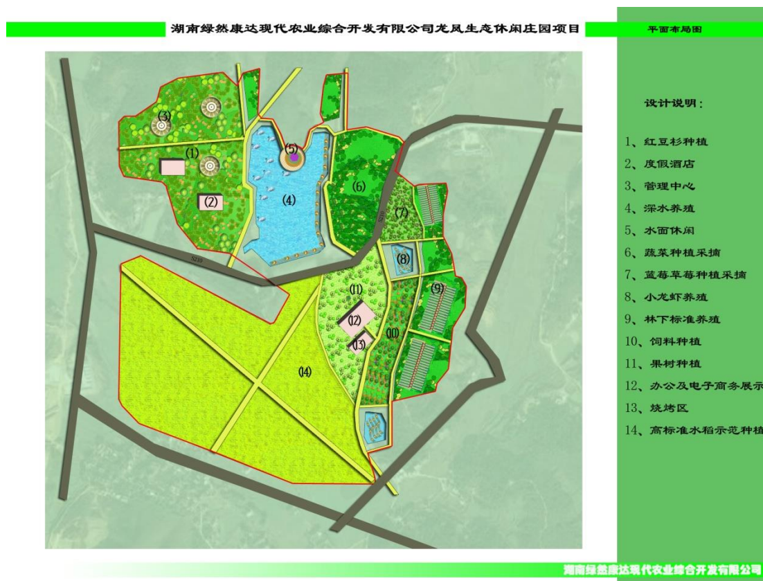
图 3-2 项目平面布局图