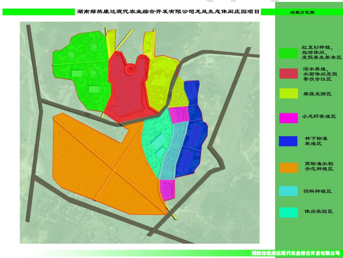
图 3-1 功能分区图